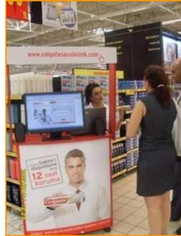
sanal klinik duyurumu