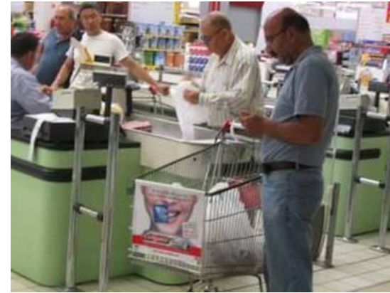
alışveriş arabası giydirme